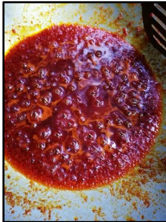
Gambar 1: Istilah konsep 'tumis sehingga pecah minyak'

sebenarnya bahan yang ditumis. Gambaran konsep 'tumis sehingga pecah minyak' adalah seperti berikut: